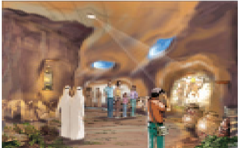
ബുർആനിൽ പരാമർശിച്ചിരിക്കുന്ന അത്ഭുതങ്ങൾ പ്രദർശിപ്പിക്കുന്ന ശീതീകരിച്ച ടണൽ ചിത്രകാരന്റെ ഭാവനയിൽ.

ദുബൈ: ബുർആനിന്റെ വിജ്ഞാനത്തിലേക്കും വിസ്മയത്തിലേക്കും സന്ദർശകരെ കൂട്ടിക്കൊണ്ടുപോകുന്ന ഹോളി ബുർആൻ പാർക്ക് ദുബൈയിൽ യഥാമർദ്ദമാകുന്നു. അൽ ഖവനീജിൽ 60 ഹെക്ടർ സ്ഥലത്ത് 2.7 കോടി ദിർഹം ചെലവഴിച്ചാണ് പാർക്ക് നിർമ്മിക്കുക. ബുർആനിൽ പരാമർശിച്ച സസ്യങ്ങൾ ഇവിടെ വെച്ചുപിടിപ്പിക്കും. വിശുദ്ധ ബുർആനിൽ പരാമർശിച്ചിരിക്കുന്ന അത്ഭുതങ്ങൾ പ്രദർശിപ്പിക്കുന്ന ശീതീകരിച്ച ടണൽ ആണ് മറ്റൊരു പ്രത്യേകത. ഇതിനായി ചിത്രങ്ങളും ശബ്ദ സംവിധാനവും സജ്ജീകരിക്കും. ദുബൈ മുനിസിപ്പാലിറ്റി ജനറൽ പ്രോജക്ട്സ് വിഭാഗമാണ് പദ്ധതിയുടെ മേൽനോട്ടം വഹിക്കുന്നത്. അടുത്ത വർഷം സെപ്റ്റംബറിൽ പാർക്ക് പൂർത്തിയാകുമെന്നാണ് പ്രതീക്ഷ.