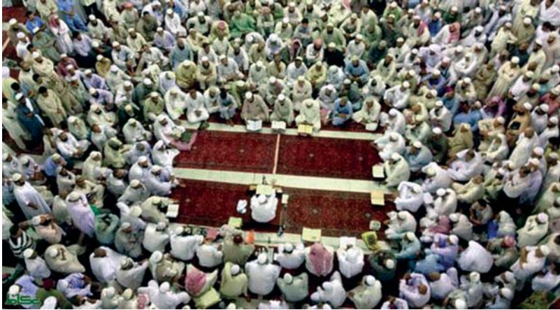
മക്കയിലെയും മദീനയിലെയും വിശുദ്ധ ഹറമുകളിൽ പ്രത്യേകം തയ്യാറാക്കിയ ഭാഗങ്ങളിൽ ഇസ്ലാമിക പഠനങ്ങൾ നടന്നുവരുന്നുണ്ട്. ഇരു ഹറം

കാര്യമായ ഉന്നത സമിതിയുടെ അനുമതിയോടെയാണ് ഇത്തരം ക്ലാസുകൾ നടക്കുന്നത്. ഖുർആൻ, ഹദീസ് പഠനങ്ങളും കർമശാസ്ത്ര വിഷയങ്ങളുമാണ് കൂടുതലായും ഇത്തരം ക്ലാസുകളിൽ നടക്കുക. ഹജ്ജും ഉറയുമായി ബന്ധപ്പെട്ട കാര്യങ്ങളിൽ സംശയ നിവാരണവും ഇത്തരം ദീനീ ദർസുകളിൽ നടക്കും. ഹറമുകളുമായി ബന്ധപ്പെട്ട സവിശേഷതകളും ചരിത്രങ്ങളുമെല്ലാം നിറഞ്ഞ ക്ലാസുകൾ സദസ്സ് സശ്രദ്ധം കേട്ടിരിക്കും. അറബിയിലാണ് മുഖ്യമായും ക്ലാസുകൾ നടക്കുന്നതെങ്കിലും ഉർദു, ഇംഗ്ലീഷ്, തുർക്കി തുടങ്ങി വിവിധ ലോകഭാഷകളിൽ ക്ലാസുകൾ നടന്നുവരുന്നുണ്ട്.