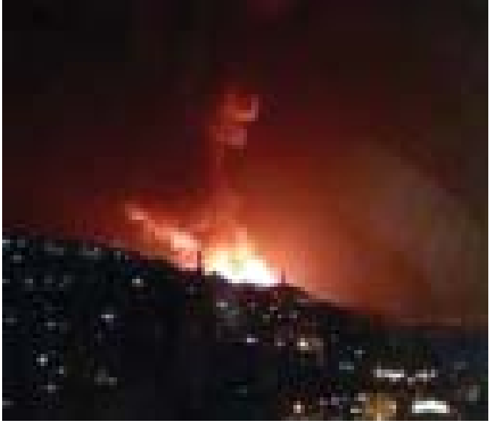
പ്രതിപക്ഷ ശബ്ദങ്ങളെ ഒതുക്കാൻ പ്രയോഗിക്കും. എന്നാൽ സ്വതന്ത്രസേനയുടെ ഭാഗമായ 'ഇസ്ലാമിസ്റ്റുകൾ' ഭീകര രാഷ്ട്രത്തിന്റെ ഉറക്കം കെടുത്തിത്തുടങ്ങിയിട്ടുണ്ട്.

യാതൊരു പ്രകോപനവുമില്ലാതെ ഇസ്രയേൽ നടത്തിയ ഖാസിയോൻ ബോംബ് വർഷത്തിന് പല കാരണങ്ങളുമുണ്ടെങ്കിലും ആയുധം തങ്ങൾക്കിഷ്ടമില്ലാത്തവരുടെ കരങ്ങളിൽ എത്തിപ്പെടുമെന്ന ഭീതി തന്നെയാണ് പ്രധാനമെന്നാണ് നിരീക്ഷകർ വിലയിരുത്തുന്നത്. അസദുമാർക്ക് ഇക്കാലമത്രയും ആയുധങ്ങൾ അലങ്കാരം മാത്രമായിരുന്നുവെന്ന് ഇസ്രയേലിനറിയാം. ഏറിയാൽ സ്വന്തം ജനത ഉയർത്തുന്ന