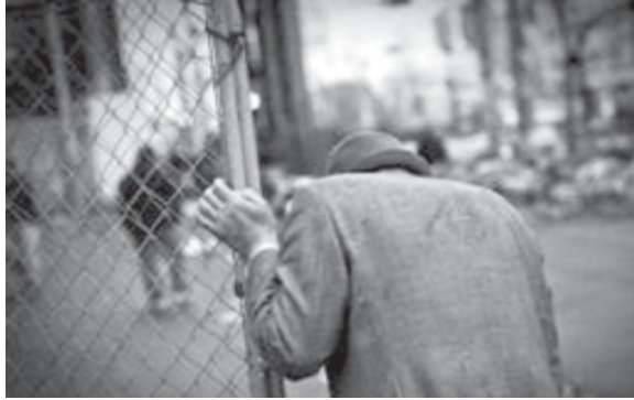
പ്രായമായവരെ വീടിന്റെ ഐശ്വര്യമായി കണ്ടിരുന്ന ഒരു കാലമുണ്ടായിരുന്നു. മുസ്ലിംകളുടെ കാര്യമാണെങ്കിൽ

ഘർഷണത്തിൽ അല്ലാഹുവിനുള്ള ഇബാദത്ത് കഴിഞ്ഞാലുടൻ അടുത്ത ഉദ്ബോധനം മാതാപിതാക്കളോടുള്ള കടമയെക്കുറിച്ചാണ്. അതിൽതന്നെ വയസ്സായവരോട് സ്വീകരിക്കേണ്ട നിലപാട് വേറെതന്നെ പറഞ്ഞിട്ടുണ്ട്. ഇത് ഓർക്കാൻ കാരണം ബഹ്റൈനിൽ 'പ്രായം ചെന്നവരെ സംരക്ഷിക്കേണ്ട' ആവശ്യകതയെക്കുറിച്ച് ഒരു അന്താരാഷ്ട്ര സമ്മേളനത്തിൽ ചർച്ച നടന്നതാണ്.