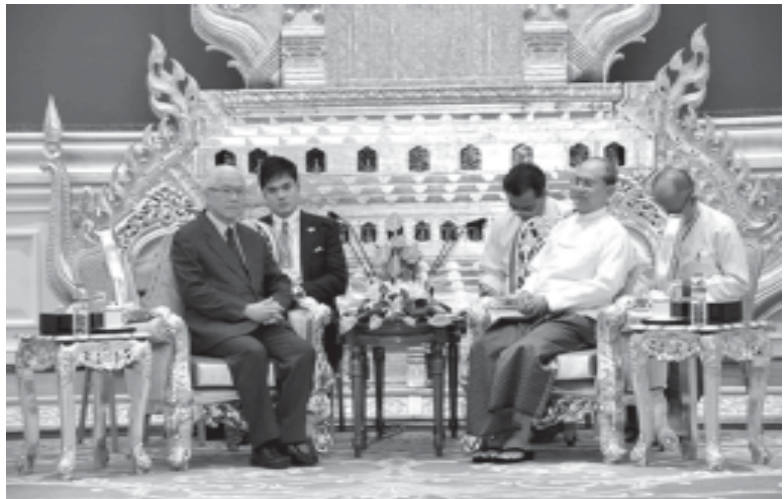
രധിവാസമടക്കമുള്ള പ്രശ്നങ്ങൾ അനുഭാവ പൂർണ്ണം പരിഗണിക്കണമെന്നും ഇന്തോനേഷ്യൻ പ്രസിഡന്റ് അഭ്യർഥിച്ചു.

മ്യാന്മയിൽ നിരന്തരം പീഡനങ്ങൾക്കിരകളാകുന്ന റോഹിജ്യ മുസ്ലിം ന്യൂനപക്ഷങ്ങളുടെ കാര്യത്തിൽ ആശങ്കയുണ്ടെന്നും വിഷയം അനുഭാവ പൂർവ്വം പരിഗണിക്കണമെന്നും ഇന്തോനേഷ്യൻ പ്രസിഡന്റ് സുസിലോ ബാബാബ്, മ്യാന്മർ പ്രസിഡന്റ് തെൻ സൈനിനോട് ആവശ്യപ്പെട്ടു. കലാപത്തിൽ നിരവധി റോഹിജ്യ മുസ്ലിംകൾ ഇതിനകം കൊല്ലപ്പെട്ടു. കുടിയിറക്കപ്പെട്ട അനേകായിരങ്ങളാണ് അഭയാർഥി ക്യാമ്പുകളിൽ കഴിയുന്നത്. ഇവരുടെ പുന