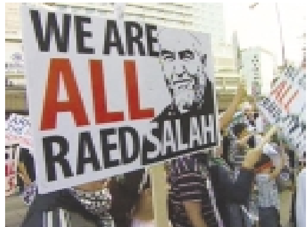
ലണ്ടനിൽ നടന്ന പ്രതിഷേധ പ്രകടനം