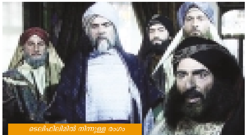
ടെലിഫിലിമിൽ നിന്നുള്ള രംഗം

ഇസ്ലാമിക ചരിത്രത്തിലെ സങ്കീർണ്ണ സംഭവങ്ങൾ ചിത്രീകരിക്കുന്ന ടെലിഫിലിം ‘ഹസൻ, ഹുസൈൻ, മുആവിയ’ റമദാനിൽ പ്രക്ഷേപണം ചെയ്യുമെന്ന് അൽഅറബിയ്യ ചാനൽ വൃത്തങ്ങൾ വ്യക്തമാക്കി. 30 ദിവസങ്ങളിലായാണ് ഒരു