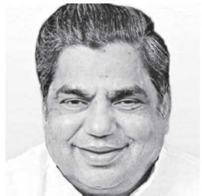
കോൺഗ്രസ് നേതാവ് ധരംസിംഗ്

കോൺഗ്രസ്സിന് ഇത്രയും അനുകൂലമായ സാഹചര്യങ്ങൾ ഇതിനു മുമ്പ് സംസ്ഥാനത്ത് ഒത്തുവന്നിട്ടില്ലായിരുന്നു. ബി.ജെ.പിയുമായി സഖ്യമുണ്ടാക്കിയതോടെ മതേതര ജനതാദളിന്റെ പ്രധാന വോട്ടുബാങ്കായ മുസ്ലിം ന്യൂനപക്ഷം കോൺഗ്രസ്സിനോട് ചാഞ്ഞതാണ് ഇതിൽ ഏറെ പ്രധാനപ്പെട്ടത്. എന്നാൽ ഇത് യഥാവിധി മുതലെടുക്കാൻ ഇവർക്കായില്ല എന്നതോടൊപ്പം, കോൺഗ്രസ്സിനെ പൂർണ്ണമായും വിശ്വാസത്തിലെടുക്കാൻ പൊതുസമൂഹം ഇനിയും തയ്യാറായിട്ടില്ല എന്ന സന്ദേശം കൂടി നൽകുന്നതാണ് തെരഞ്ഞെടുപ്പ് ഫലം. ദേശീയ തലത്തിൽ