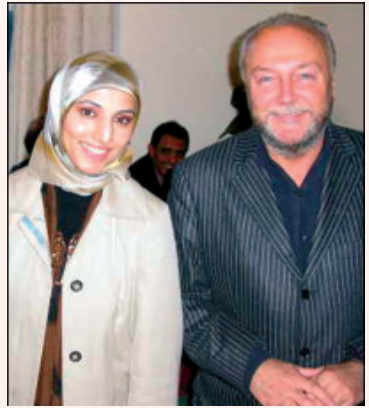
സൽമാ യഅ്ഖൂബിൻ ജോർജ്ജ് ഗലോവെ

യാഥാസ്ഥിതിക കക്ഷിക്ക് കിട്ടിയ സീറ്റ് 306; കഴിഞ്ഞ തവണത്തേക്കാൾ 97 സീറ്റ് കൂടുതൽ. ലേബർ പാർട്ടിയുടെ വിഹിതം 258; കഴിഞ്ഞ തവണത്തേക്കാൾ 91 സീറ്റ് കുറവ്. ലിബറൽ ഡെമോക്രാറ്റുകൾക്ക് 57 സീറ്റ്; അവർക്കും നഷ്ടപ്പെട്ടു അഞ്ച് സീറ്റ്. ഇതാണ് നിലവിലെ ബ്രിട്ടീഷ് തൃതീയ പാർലമെന്റിലെ കക്ഷിനില. നയങ്ങളിൽ തീരെ ഒക്കാത്ത യാഥാസ്ഥിതികരും ലിബറൽ ഡെമോക്രാറ്റുകളും തൽക്കാലം ഒരു മന്ത്രിസഭ തട്ടിക്കൂട്ടിയിട്ടുണ്ട്. അതിന്റെ ആയുസ്സ് കണ്ടു തന്നെ അറിയണം.