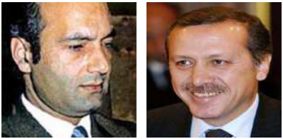
■ അലി ശരീഅത്തി ■ റജബ് ഉർദുഗാൻ

ഈ പുതിയ ലോകത്ത് ഇസ്ലാമിനെ എങ്ങനെ അല്ലെെ ചെയ്യണം എന്ന ആലോചനയെയാണ് ഈ തലക്കെട്ട് യഥാർത്ഥത്തിൽ പ്രതിനിധീകരിക്കുന്നത്. ഇത് ഇസ്ലാമിക പ്രസ്ഥാനങ്ങളുടെയും പണ്ഡിതന്മാരുടെയും ചിന്തകന്മാരുടെയും ആലോചനകളിലേക്ക് അടുത്ത കാലത്തായി അതിശക്തമായി വന്നിട്ടുണ്ട്. മാത്രവുമല്ല, സെക്യൂലർ മോഡേണിറ്റിയുടെ മലവെള്ളപ്പാച്ചിലിന്റെ കാലത്ത് ഇസ്ലാമിക ചിന്തയെയും രാഷ്ട്രീയ സ്വതന്ത്രതയെയും ഉയർത്തിപ്പിടിച്ച പ്രസ്ഥാനങ്ങളും അതിന്റെ പിന്തുടർച്ചക്കാരാണ് ഇന്ന് ഈ ചിന്തയുടെയും കൊടിവാഹകരായി നിലനിൽക്കുന്നത്. സൈദ്ധാന്തിക രംഗത്ത് ഈ സ്വഭാവത്തിൽ ഇസ്ലാമിക ചിന്തകളെ, ഫിഖ്ഹിനെ എങ്ങനെ പുനർനിർണയിക്കാം എന്നതിനെക്കുറിച്ച് അതിശക്തമായ ആലോചനകൾ ഇസ്ലാമിക ചിന്തകന്മാരുടെ ഇടയിൽ നടന്നുകൊണ്ടിരിക്കുകയാണ്. മുസ്ലിംകൾക്ക് ജീവിക്കാൻ വേണ്ടിയുള്ള കുറെ നിയമാവലികൾ എന്നതിനപ്പുറം പുതിയ നാഗരികതക്കാവശ്യമായ പ്രചോദക കേന്ദ്രമായി, രീതിശാസ്ത്രമായി ഫിഖ്ഹിനെ മാറ്റിയെടുക്കണം എന്നതാണ് ഏറ്റവും പ്രസക്തമായ നമ്മുടെ സൈദ്ധാന്തിക ദൗത്യം. മുസ്ലിംകളുടെ ദൈനംദിന ആവശ്യങ്ങളുടെ പൂർത്തീകരണത്തിന് വേണ്ടിയുള്ള ഒരു സംവിധാനം എന്നതിനപ്പുറം പുതിയ ലോകത്തെ എങ്ങനെ നിർണയിക്കാം എന്നതാണ് ഫിഖ്ഹ് ഇപ്പോൾ അഭിമുഖീകരിക്കുന്ന ഏറ്റവും വലിയ വെല്ലുവിളി.