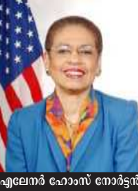
എലേനർ ഹോംസ് നോർട്ടൻ

“എല്ലാ നിയമസാധുതകളോടെയും അമേരിക്കയിൽ താമസിക്കുന്ന ഒരു വിഭാഗത്തെ ഭീകരന്മാരായി കാണുകയാണ് അമേരിക്കൻ വിമാനത്താവള അധികൃതർ. ഈ വംശീയ തരംതിരിവ് (racial profiling) സകല പരിധിയും ലംഘിച്ചിരിക്കുന്നു” - പറയുന്നത് അമേരിക്കൻ കോൺഗ്രസ് അംഗം എലേനർ ഹോംസ് നോർട്ടൻ. വ്യോമഗതാഗതത്തെക്കുറിച്ച് പ്രശ്നങ്ങൾ പഠിക്കുന്ന പ്രതിനിധിസഭാ സബ്കമ്മിറ്റിയിലും അവർ അംഗമാണ്. ഒർലൻഡോയിലേക്ക് പോകുന്ന ഒരു വിമാനത്തിൽനിന്ന് കുട്ടികൾ ഉൾപ്പെടെ ഒരു ദമ്പതം മുസ്ലിം കുടുംബത്തെ ഇറക്കിവിട്ടതിനെക്കുറിച്ച് പ്രതികരിക്കുകയായിരുന്നു എലേനർ. ‘സുരക്ഷിത സീറ്റ്’ എന്ന് ഈ കുടുംബത്തിലെ ഒരാൾ പറയുന്നത് യാത്രക്കാരിലൊരാൾ കേട്ടത്രെ. ഉടൻ പോലീസെത്തി ഇവരെ കൈയാമംവെച്ച് പിടിച്ചു കൊണ്ടു പോയി. അഞ്ച് മണിക്കൂർ എയർപോർട്ടിൽ തടഞ്ഞുവെച്ചു. കുറ്റക്കാരല്ലെന്ന് കണ്ടിട്ടും ടിക്കറ്റിന്റെ പണം തിരിച്ചു നൽകിയില്ല.