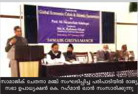
സാമാജിക ചേതനാ മഞ്ചി സംഘടിപ്പിച്ച പരിപാടിയിൽ രാജ്യസഭാ ഉപാധ്യക്ഷൻ കെ. റഹ്മാൻ ഖാൻ സംസാരിക്കുന്നു