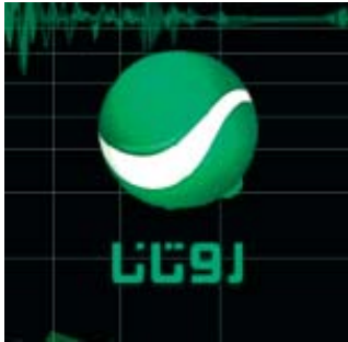
■ റോത്താനയുടെ എംബ്ലം

‘ഗൾഫ് ഉപഗ്രഹ ചാനൽ ലോകത്ത് മർഡോക്ക് ദുർഗന്ധം’ എന്നാണ് മുതിർന്ന അറബ് പത്രപ്രവർത്തകൻ ഫഹ്മി ഹുവൈദി അതിനെ വിശേഷിപ്പിച്ചത്. സംഭവം, ലോക മീഡിയാ കഴുകൻ റൂപ്പേർട്ട് മർഡോക്കിന്റെ ഗൾഫ് രാജ്യങ്ങളിലേക്കുള്ള കടന്നുകയറ്റം തന്നെ. തന്റെ മീഡിയാ സാമ്രാജ്യത്തിന്റെ പുതിയ ആസ്ഥാനങ്ങളിലൊന്ന് അബുദബി ആയിരിക്കുമെന്നാണ് മർഡോക്ക് ഈയിടെ പ്രഖ്യാപിച്ചത്. ഹോംകോണ്ട് ആസ്ഥാനമായുള്ള ചില മർഡോക്കിയൻ ചാനലുകൾ ഏറെ വൈകാതെ അബുദബിയിലേക്ക് നീങ്ങും. അറബ് ലോകത്തെ മാധ്യമ ചക്രവർത്തി എന്ന് വിശേഷിപ്പിക്കാവുന്ന അമീർ വലീദ്ബ്നു തലാലിന്റെ നേതൃത്വത്തിലുള്ള ‘റോത്താന’യുമായി കരാറൊപ്പിച്ചുകൊണ്ടാണ് മർഡോക്ക് ചുവടുറപ്പിക്കുന്നത്. കരാർ പ്രകാരം റോത്താനയുടെ പത്തു ശതമാനം ഓഹരി ഇനി മർഡോക്കിനായിരിക്കും. ആറ് ചാനലുകളും ഒരു സിനിമാ നിർമ്മാണ കമ്പനിയുമുണ്ട് റോത്താനക്ക് കീഴിൽ. ഓഹരി സ്വന്തമാക്കാൻ എഴുപത് മില്യൻ ഡോളറാണ് മർഡോക്ക് നൽകിയത്. വരും വർഷങ്ങളിൽ ഓഹരി വിഹിതം കൂടാനാണ് സാധ്യത.