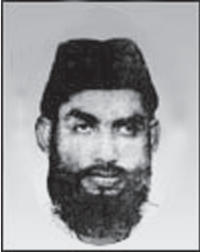
■ ഹാജി സാഹിബ്

അറുപത്തിയൊന്നാം വർഷത്തിൽ പ്രബോധനത്തിന് സുപ്രധാനമായ ചുവടുവെപ്പുകളുണ്ടാകണമെന്ന് ഇസ്‌ലാമിക പ്രസ്ഥാനം ആഗ്രഹിക്കുന്നു. കെട്ടിലും മട്ടിലും ഉള്ളടക്കത്തിലും കേരളീയ ആനുകാലികങ്ങളുടെ മുന്നിലെത്താൻ ഇനിയും നാം സഞ്ചരിക്കേണ്ടതുണ്ട്. പ്രബോധനത്തെ നെഞ്ചിലേറ്റേണ്ടത് നമ്മളാണ്. ആദ്യകാല പ്രവർത്തകരെ പോലെ പ്രബോധനം ഓരോ ലക്കവും പൂർണ്ണമായി വായിക്കാൻ മനസുവെക്കണം. വായിക്കുന്ന വർക്കേ അതിന്റെ വില മനസ്സിലാക്കുകയുള്ളൂ. നമ്മുടെ ആദ്യകാല തലമുറയുടെ അറിവും അനുഭവവും വർദ്ധിച്ചത് പ്രബോധനം വായനയിലൂടെയായിരുന്നു.