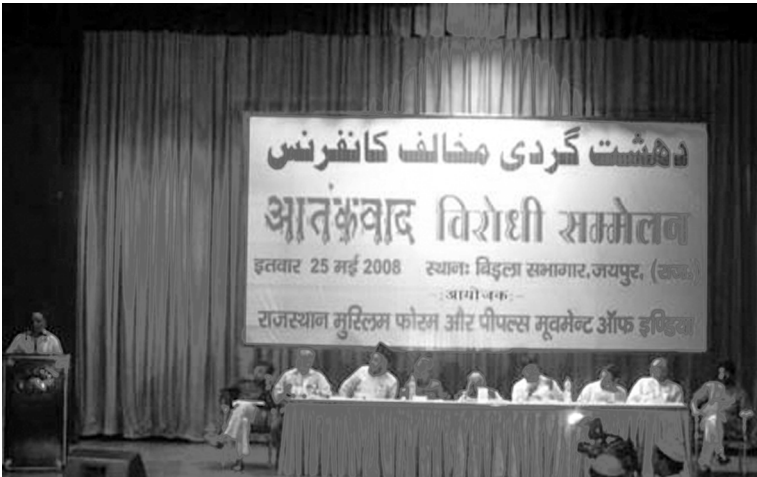
ജയ്പൂരിൽ സംഘടിപ്പിച്ച ഭീകരതാ വിരുദ്ധ സമ്മേളനം

പോയ പലരും നിരപരാധികളാണെന്ന് തെളിഞ്ഞിട്ടും അവരെ വിട്ടയച്ചിട്ടില്ല. മുസ്‌ലിം സംഘടനകളെ മാത്രം സംശയിക്കുകയും മറ്റു സംഘടനകളെ സംശയിക്കാതിരിക്കുകയും ചെയ്യുന്നത് നിതിബോധത്തിന് നിരക്കുന്നതല്ലെന്നും പ്രതിനിധി സംഘം ഐ.ജിയോട് പറഞ്ഞു. പരാതികൾ പരിശോധിക്കാമെന്നും വേണ്ട നടപടികൾ സ്വീകരിക്കാമെന്നും ഐ.ജി പ്രതിനിധിസംഘത്തിന് ഉറപ്പുനൽകി.