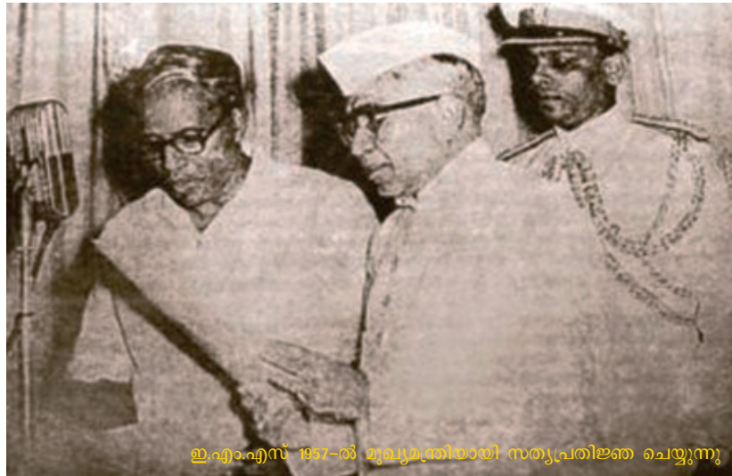
ഇ.എം.എസ് 1957-ൽ ഇന്ത്യയിലായി സത്യപ്രതിജ്ഞ ചെയ്യുന്നു