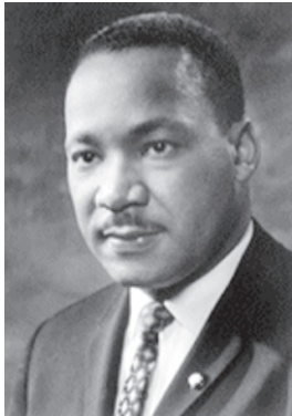
മാർട്ടിൻ ലൂഥർ കിംഗ്