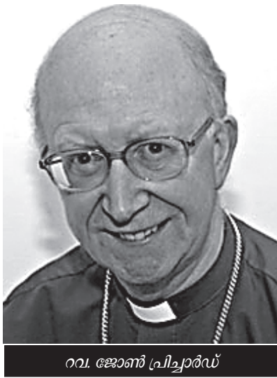
റവ. ജോൺ പ്രിച്ചാർഡ്

കാൻറർബറി ബിഷപ്പിനുപിന്നാലെ ഓക്സ്ഫോർഡ് ബിഷപ്പും വിവാദക്കുരുക്കിലേക്ക്. തന്റെ പ്രഭാഷണത്തിൽ ശരിഅത്തിനെക്കുറിച്ച് ഒരു അഭിപ്രായം പറഞ്ഞതിന് ഭരണകൂടവും മീഡിയയും കാൻറർബറി ബിഷപ്പിനെ വേട്ടയാടുകയായിരുന്നു. അതിനേക്കാൾ നിസ്സാരമായ ഒരു കാര്യത്തിനാണ് ഓക്സ്ഫോർഡ് ബിഷപ്പ് റവ. ജോൺ പ്രിച്ചാർഡ് പ്രതികൂട്ടിലായത്. ഓക്സ്ഫോർഡിലെ മുസ്ലിം പള്ളിയിൽ ബാങ്കുവിളി ഉച്ചഭാഷിണിയിലൂടെയാവുന്നതിന് തനിക്ക് വിരോധമില്ലെന്ന് അദ്ദേഹം പറഞ്ഞുപോയി. ഉടൻവന്ന ഒരു ഇ-മെയിൽ സന്ദേശം -സൂക്ഷിച്ചോ, തട്ടിക്കളയൂ. അടുത്ത് കിട്ടിയിരുന്നെങ്കിൽ മുഖത്ത് തൂപ്പും എന്ന് മറ്റൊരാൾ. രാജിവെക്കണമെന്ന് മറ്റൊരു സന്ദേശം.