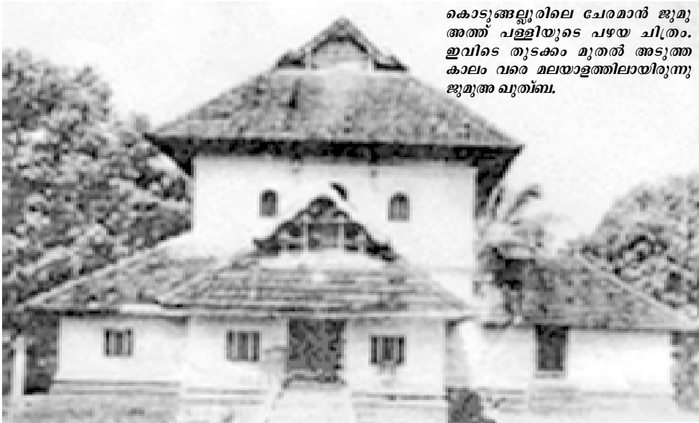
കൊടുങ്ങല്ലൂരിലെ ചേരമാൻ ജുമു അത്ത് പള്ളിയുടെ പഴയ ചിത്രം. ഇവിടെ തുടക്കം മുതൽ അടുത്ത കാലം വരെ മലയാളത്തിലായിരുന്നു ജുമു അദ്ധ്യക്ഷൻ.