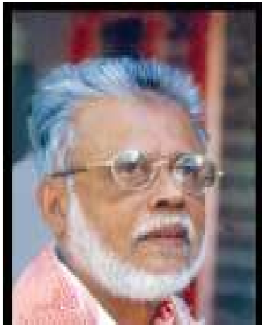
എസ്.എം തമ്പിബ് ആലപ്പുഴ