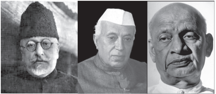
■ അബുൽ കലാം ആസാദ് ■ ജവഹർലാൽ നെഹ്റു ■ സർദാർ വല്ലഭായി പട്ടേൽ