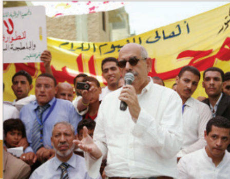
മുഹമ്മദ് ബറാദഇ ഈജിപ്തിലെ ഒരു പര്യടനത്തിനിടയിൽ

ആ നിലപാടിൽനിന്ന് മാറി മത്സരിക്കാൻ തന്നെ അദ്ദേഹം തീരുമാനിച്ചിരിക്കുകയാണ്. പിന്തുണ തേടി അദ്ദേഹം ആദ്യം ചെന്നത് ഇഖ്വാനുൽ മുസ്‌ലിമിന്റെ പാർലമെന്ററി പാർട്ടി ഓഫീസിലേക്കാണ്. ഇഖ്വാൻ അനുകൂലമായാണ് പ്രതികരിച്ചത്. രാജ്യത്തെ ഏറ്റവും വലിയ പ്രതിപക്ഷമായ ഇഖ്വാനുൽ മുസ്‌ലിമിന്റെ പാർട്ടി രൂപവത്കരിക്കാനുള്ള അനുകൂല വാദം നൽകണമെന്ന് അദ്ദേഹം ആവശ്യപ്പെട്ടു. ഇഖ്വാന്റെ മുഖ്യ കാര്യദർശിയെയും അദ്ദേഹം അടുത്തു തന്നെ കാണും. ഇടതുപക്ഷവുമായും ചർച്ചകൾ നടത്തുന്നുണ്ട്. ഏതായാലും ബറാദഇ വലിയ