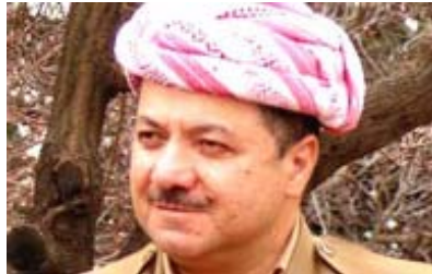
■ മസ്ഊദ് ബർസാനി

ഇറാഖിലെ സ്ത്രീകൾ ജീവിക്കാൻ വേണ്ടി മാനം വിൽക്കുന്നതൊന്നും അവിടത്തെ ഭരണാധികാരികളുടെ ശമ്പളത്തെ തെല്ലും ബാധിക്കുകയില്ല. കെട്ടുകഥയോ എന്ന് തോന്നിപ്പിക്കുംവിധം ഭീമമായ തുകയാണ് ഓരോരുത്തനും ശമ്പളയിനത്തിൽ അടിച്ചു മാറ്റുന്നത്. കുർദിസ്താൻ പ്രവിശ്യയുടെ പ്രസിഡന്റ് മസ്ഊദ് ബർസാനിയുടെ മാസാന്ത ശമ്പളം എത്രയെന്നോ, നാല് ലക്ഷം ഡോളർ! അമേരിക്കൻ പ്രസിഡന്റ്