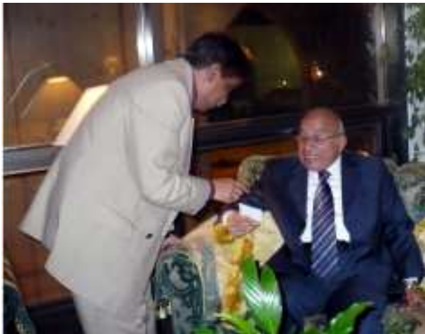
ഫഹ്മീ ഹുവൈദിയോടൊപ്പം കുറിപ്പുകാരൻ