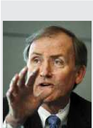
റോബർട്ട് എം. കിമ്മിറ്റ്

ആസ്ഥാനം നിലകൊള്ളുന്ന മൻസൂറ തെരുവിന്റെ മാതൃകയിൽ ഇസ്ലാമാബാദിൽ ഒരു കൊർദോവ തെരുവ് പണിയാൻ ജമാഅത്തിന് ഉദ്ദേശ്യമുണ്ടെന്ന് പാക് ജമാഅത്ത് അമീർ ഖാദി ഹുസൈൻ അഹ്മദ് അറിയിച്ചു. അമേരിക്കൻ ഇടപെടലും ഭരണകൂടത്തിന്റെ അമേരിക്കൻ വിധേയത്വവുമാണ് സമ്മേളനത്തിൽ കാര്യമായും ചർച്ച ചെയ്യപ്പെട്ടത്. ഗോത്ര മേഖലയിൽ അമേരിക്കൻ സൈന്യം കടന്നുകയറുക മാത്രമല്ല, ആമേഖലയെ പാകിസ്താനിൽനിന്ന് അടർത്തിമാറ്റാൻ പാക് സൈന്യം ഗൂഢാലോചന നടത്തുകയാണെന്നും ഖാദി ഹുസൈൻ ആരോപിച്ചു. ചില്ലറ മാറ്റങ്ങൾ വരുത്തി ഇന്ന് നേരിടുന്ന പ്രതിസന്ധികളെ അതിജീവിക്കാനാവില്ലെന്നും സമൂലമായ ഭരണഘടനാ പരിഷ്കാരമാണ് അതിനുള്ള പോവഴിയെന്നും പാക് ജമാഅത്തിന്റെ അസി. അമീർ പ്രഫ. ഖുർശിദ് അഹ്മദ് അഭിപ്രായപ്പെട്ടു. ട്രെയിൻ ജാഥകളായിരുന്നു സമ്മേളന പ്രചാരണ പരിപാടികളിൽ പുതുമയുള്ള ഇനം. ■