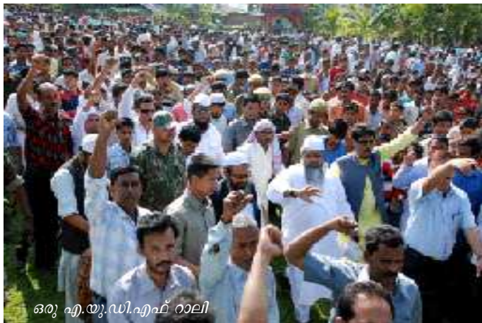
ഒരു എ.യു.ഡി.എഫ് റാലി

മൗലാനാ ബദ്റുദ്ദീൻ അജ്മൽ നേതൃത്വം നൽകുന്ന ആസാം യൂണൈറ്റഡ് ഡെമോക്രാറ്റിക് ഫ്രണ്ട് (എ.യു.ഡി.എഫ്) വരുന്ന ലോക്സഭാ തെരഞ്ഞെടുപ്പിൽ എട്ട് മണ്ഡലങ്ങളിൽ മത്സരിക്കും. ആസാമിൽ മൊത്തം പതിനാല് ലോക്സഭാ മണ്ഡലങ്ങളാണുള്ളത്. ചുരുങ്ങിയത് അഞ്ച് സീറ്റിലെങ്കിലും പാർട്ടിക്ക് വിജയസാധ്യതയുണ്ടെന്ന് എ.യു.ഡി.എഫ് വൃത്തങ്ങൾ അറിയിച്ചു.