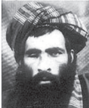
■ മുല്ലാ ഉമർ

ഏറ്റവുമധികം പൗരസ്വാതന്ത്ര്യമുണ്ട് എന്ന് കരുതപ്പെടുന്ന ഒരു രാജ്യത്ത് നിന്നും ഉയരുന്ന ഇത്തരം തീവ്രനിലപാടുകൾ ആരെയും അമ്പരപ്പിക്കാതിരിക്കില്ല. തോന്നുന്ന പോലെയൊക്കെ തുണിയുരിയാൻ സ്ത്രീക്ക് അനുവാദം നൽകുന്ന ഒരു നിയമവ്യവസ്ഥ, സ്ത്രീകൾ മുഖം മറയ്ക്കുന്നതിൽ ഇത്ര അസഹിഷ്ണുത കാണിക്കുന്നത് എന്തിന് എന്നാണ് മനസ്സിലാവാത്തത്.