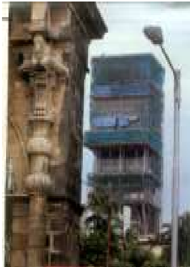
■ മുംബൈയിലെ വഖ്ഫ് ഭൂമിയിൽ ഉയരുന്ന മുകേഷ് അംബാനിയുടെ ബംഗ്ലാവ്

ഇതിനെക്കുറിച്ച് അന്വേഷിക്കാൻ രാജ്യസഭ ഡെപ്യൂട്ടി ചെയർമാൻ റഹ്മാൻ ഖാൻ അധ്യക്ഷനായി ഒരു സംയുക്ത പാർലമെന്ററി കമ്മിറ്റിയെ നിശ്ചയിച്ചിരുന്നു. സംസ്ഥാനങ്ങളിലെ വഖ്ഫ് ബോർഡുകൾ അപ്പടി പുനഃസംഘടിപ്പിക്കണമെന്നാണ് കമ്മിറ്റി മുന്നോട്ടുവെച്ച