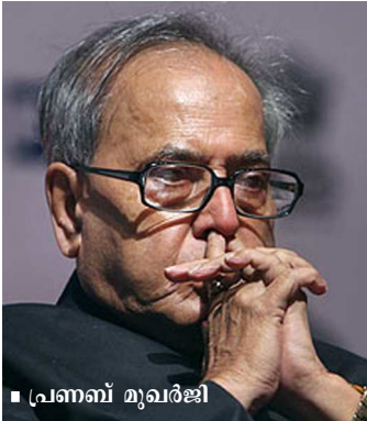
■ പ്രണബ് മുഖർജി