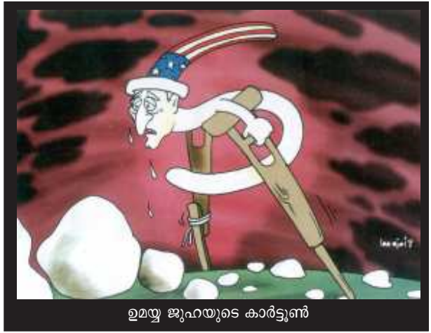
ഉയ്യ ജുഹയുടെ കാർട്ടൂൺ

പ്രകൃതിവിഭവങ്ങളാൽ സമൃദ്ധവും ഫിലിപ്പൈൻ ദ്വീപുകളിൽ ഏറ്റവും സമ്പന്നവുമാണ് മിൻഡനാവോ. അഞ്ച് മില്യനിലധികം മുസ്ലിംകൾ ഇവിടെയുണ്ട്. കത്തോലിക്കർക്ക് ഭൂരിപക്ഷമുള്ള ഫിലിപ്പൈൻസിൽ എട്ടു ശതമാനമാണ് മുസ്ലിം ജനസംഖ്യ. ■