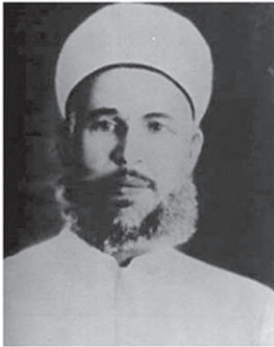
■ ഇസ്ലാമിൻ അൽഖസ്സാം

ഫലസ്തീനികൾക്ക് ഒരിക്കലും മറക്കാനാവാത്ത പേരാണ് ഇസ്ലാമിൻ അൽ ഖസ്സാം. ഫലസ്തീനിയല്ലാതെ മറ്റെങ്ങും ഫലസ്തീനികളുടെ മനസ്സിൽ ഇത്രയധികം ആഴത്തിൽ പതിഞ്ഞ മറ്റൊരു പോരാളിയുടെ പേര് കണ്ടെത്തുക പ്രയാസം. ആ സ്മരണ അനശ്വരമാക്കാൻ ഹമാസ് അവരുടെ സൈനിക വിംഗിന് അൽഖസ്സാം ബ്രിഗേഡ്സ് എന്നാണ് പേരിട്ടത്. ജുതരാഷ്ട്രത്തിന് മണ്ണൊരുക്കാനുള്ള ബ്രിട്ടീഷ് കൊളോണിയലിസത്തിന്റെ ഉപജാപങ്ങളെ തുറന്നെറിഞ്ഞ അൽഖസ്സാമിനെ ബ്രിട്ടീഷ് സേന പിടികൂടി വധിക്കുകയായിരുന്നു- 1935 നവംബർ 20-ന്. ആ പോരാളിയുടെ രക്തസാക്ഷിത്വത്തിന് 75 വർഷം പൂർത്തിയാവുമ്പോഴും സയണിസ്റ്റ് വൈതാളികർക്ക് അദ്ദേഹത്തോടുള്ള കലി അടങ്ങിയിട്ടില്ലെന്ന് റിപ്പോർട്ടുകൾ വ്യക്തമാക്കുന്നു. അധിനിവേശ ഫലസ്തീനിലെ ഹൈഫാ നഗരത്തിനടു