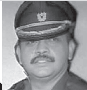
കേശവ് ശ്രീകാന്ത് പുരോഹിത: ഭീകര സംഘടനയായ അഭിനവ് ഭാരതിന്റെ സ്ഥാപകരിലൊരാൾ. നാസി കിലെ മിലിറ്ററി ഇന്റലിജൻസിൽ ജോലി ചെയ്തിരുന്നു. മറ്റു സൈനിക ഓഫീസർമാരെ ഭീകര സംഘത്തിൽ ചേർക്കാൻ ശ്രമിച്ചു. 2008ലെ മാലേഗാവ് സഫോടനത്തിന് ആർ.ഡി.എക്സ് എത്തിച്ചു കൊടുത്തു.