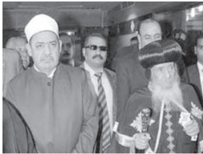
● അഹ്മദ് തയ്യിബ്, ഷനൂദ മൂന്നാമൻ

മധ്യപൗരസ്ത്യ ദേശത്തെ (ഈ ജീപ്തിനെ ഉദ്ദേശിച്ച്) ക്രിസ്ത്യാനികളെ സംരക്ഷിക്കാൻ ലോകനേതാക്കൾ രംഗത്തിറങ്ങണമെന്ന പോപ്പ്