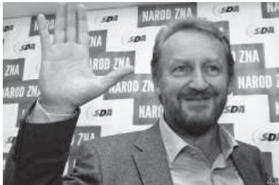
● ബാകിർ ബഗോവിച്ച്

വിചിത്രവും സങ്കീർണ്ണവുമാണ് ബോസ്നിയയിലെ തെരഞ്ഞെടുപ്പ് രീതികൾ. ഇവിടെ പ്രസിഡന്റ് ഒന്നല്ല, മൂന്ന് പേരാണ്. ഇവർ വംശീയാടിസ്ഥാനത്തിൽ തെരഞ്ഞെടുക്കപ്പെടുന്നു. ബോസ്നിയൻ മുസ്ലിംകളിൽ നിന്നും സെർബുകളിൽ നിന്നും ക്രൊയാറ്റുകളിൽ നിന്നും ഓരോ പേർ വീതം. ഈ പ്രസിഡൻഷ്യൽ സമിതിയിലേക്ക് ഏറ്റവും കൂടുതൽ വോട്ട് നേടി തെരഞ്ഞെടുക്കപ്പെട്ടയാളാണ് ആദ്യം പ്രസിഡന്റാവുക. കാലാവധി എട്ടു മാസം. പിന്നെ ഓരോ എട്ടു മാസവും പ്രസിഡന്റ് മാറിക്കൊണ്ടിരിക്കും. പാർലമെന്റ് തെരഞ്ഞെടുപ്പിലും വംശീയ വിഭജനം പ്രകടമായി കാണാം. സെർബ് വംശജർക്ക് ബോസ്നിയക്കകത്ത് തന്നെ പ്രത്യേക പാർലമെന്റാണ്. മുസ്ലിം-ക്രൊയാറ്റ് വിഭാഗങ്ങൾക്ക് മറ്റൊരു പാർലമെന്റും. ബോസ്നിയൻ വംശഹത്യക്ക് അറുതി വരുത്തിക്കൊണ്ട് പതിനഞ്ച് വർഷം മുമ്പ് ഒപ്പ് വെച്ച ഡായ്റ്റ്ൻ കരാർ പ്രകാരമാണ് ഈ സംവിധാനം നിലവിൽ വന്നത്. കരാർ പക്ഷപാതപരമാ