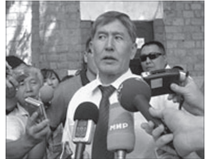
● അൽമാദ് ബെക്

കിർഗിസ്താന്റെ പുതിയ പ്രസിഡന്റായി അൽമാദ് ബെക് അതാബായെഫ് തിരഞ്ഞെടുക്കപ്പെട്ടു. ഇദ്ദേഹം ഡമോക്രാറ്റിക് സോഷ്യലിസ്റ്റ് പാർട്ടിയുടെ നേതാവാണ്. മൂന്നണി ഘടക കക്ഷികളിൽ നിന്നുള്ളവരാണ് ഉപപ്രധാനമന്ത്രിയും പാർലമെന്റ് സ്പീക്കറും. മുൻ പ്രസിഡന്റ് കിർമാൻ സക് ബാകയേഫിന്റെ ഭരണകാലത്തുണ്ടായ വ്യാപകമായ അതിക്രമങ്ങൾക്കും രാഷ്ട്രീയ അസ്ഥിരതക്കും അറുതിവരുത്താൻ പുതിയ ഭരണകൂടത്തിന് കഴിയുമെന്നാണ് പ്രതീക്ഷ. ■